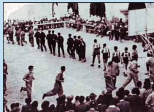
Campli. Piazza Vittorio Emanuele II. Fase di riscaldamento del torneo a cui partecipa anche la Nazionale militare. Anno 1962 circa.