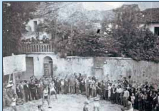
Campli. Piazza della Misericordia. Fase di gioco fra le squadre di Campi e Teramo (canotta con fascia). Si nota tra il pubblico una numerosa partecipazione femminile. Fine anni trenta del Novecento.